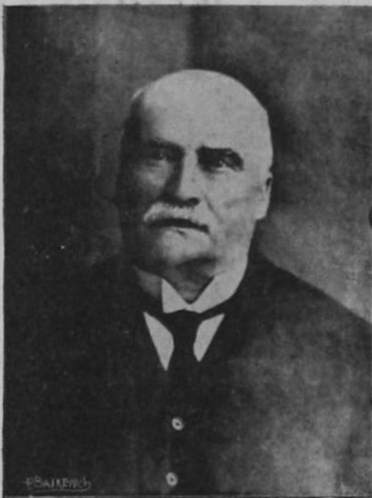
Dr. Marco Fidel Suárez

Por los datos anteriores se ve que son tres grandes fracciones las que sustentan la candidatura del doctor Valencia en contra de la del doctor Suárez, sostenida por el Partido Conservador Clerical.